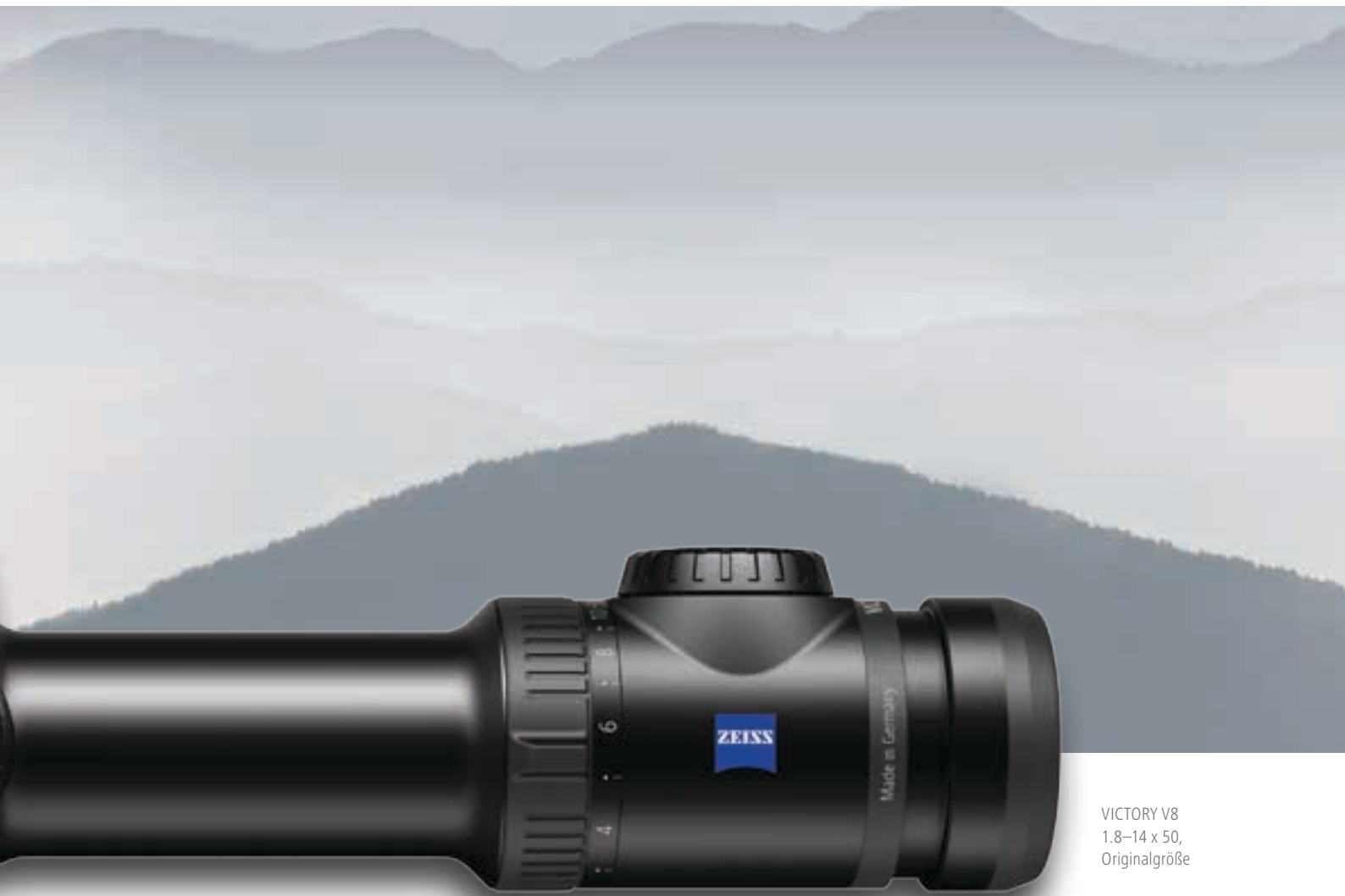
VICTORY V8 1.8-14 x 50, Originalgröße